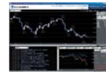
ハイパーチャート