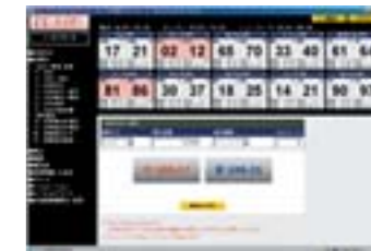
ワンクリックで注文約定するストリーミング注文

FX ハイパーは従来のFXダイレクトに比べ、レバレッジを最大100倍に引き上げることで、様々なシーンで資金効率を重視した取引を可能にします