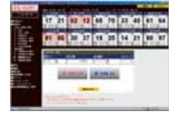
ワンクリックで注文約定するストリーミング注文

FX ハイパーは従来のFXダイレクトに比べ、レバレッジを最大100倍に引き上げることで、様々なシーンで資金効率を重視した取引を可能にします