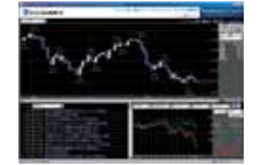
ハイパーチャート