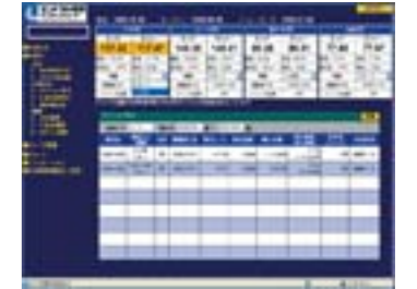
24時間いつでも自由にトレードできます。

ロスカットやマージンコールがありませんので中長期的に外貨を保有し、 安定してスワップ金利を受取りたい方に向いています。